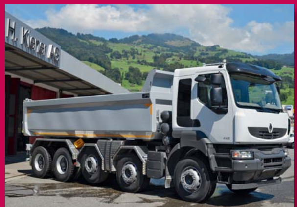
Kerax 10x4; 520 PS; Rückwärtskipper; Leergewicht 15600kg